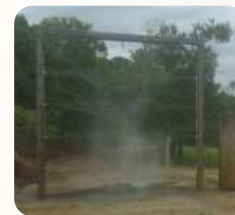
Inversiones para la certificación - Bioseguridad