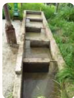
Producción más limpia