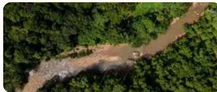
Soluciones basadas en la naturaleza