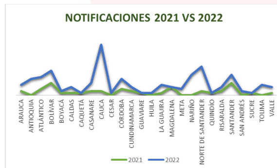
Gráfico 1. Notificaciones casos compatibles 2021 vs 2022

En este contexto el presente boletín pretende mantener informados a los poricultores sobre dichos reportes, con el fin de que puedan mantener adecuadas medidas de prevención en sus predios. Durante el primer semestre del año, se han reportado 108 notificaciones de cuadros clínicos compatibles con PPC en 21 departamentos del país.