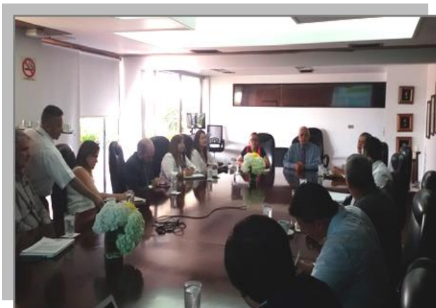
Imagen 10. Reunión Director CVC- Porkcolombia-FNP

Esta directriz fue construida teniendo en cuenta la importancia ambiental respecto a la vulnerabilidad intrínseca de los acuíferos ubicados en el Valle del Cauca, el tipo de suelos y las condiciones meteorológicas de la zona. Como resultado de estas reuniones Porkcolombia- FNP presentó el proyecto de directriz de legalidad, la cual está siendo evaluada por la dirección técnica y jurídica de la Corporación.