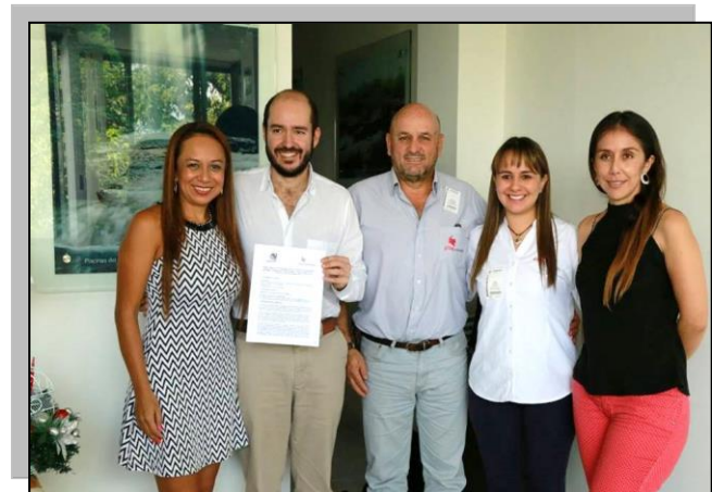
Imagen 9. Suscripción agenda ambiental Cormacarena-Porkcolombia-FNP

Se suscribe entre Porkcolombia-FNP y Cormacarena la agenda ambiental para el desarrollo sostenible del área de manejo especial de La Macarena. Esta agenda busca incentivar la legalidad de los productores para transformar la porcicultura del departamento del Meta en una actividad responsable, eficiente y sostenible en el manejo de los recursos naturales; sin dejar a un lado el entendimiento social con la comunidad.