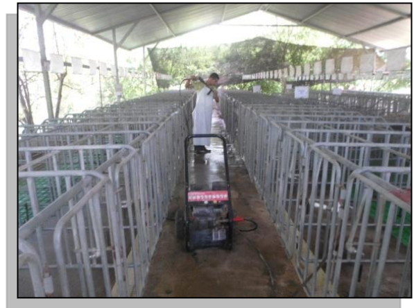
Imagen 1. Granja Villa Nora- Baranoa- Atlántico. Implementación de prácticas de ahorro y uso eficiente del agua.

En virtud del trabajo conjunto desarrollado de manera conjunta entre Porkcolombia y la CRA se realizaron visitas de acompañamiento y seguimiento a los productores porcícolas, en las cuales se realiza el levantamiento de la línea base a las granjas porcícolas, respecto al cumplimiento de la normativa ambiental vigente y buenas prácticas ambientales. Como resultado de éste trabajo se ha optimizado la legalidad ambiental del sector porcícola en los municipios ubicados bajo jurisdicción de la CRA.