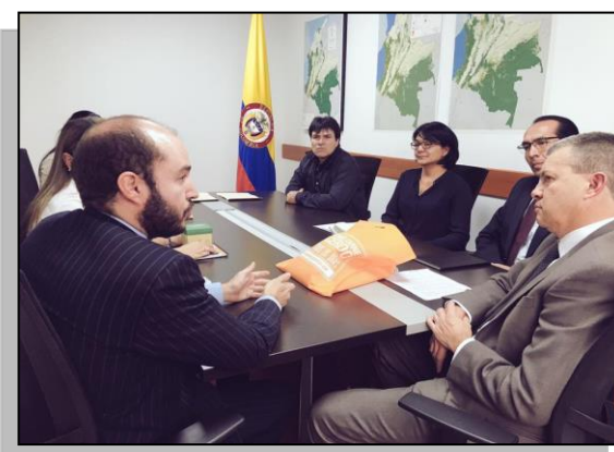
Imagen 11. Suscripción agenda ambiental MADS-Porkcolombia- FNP