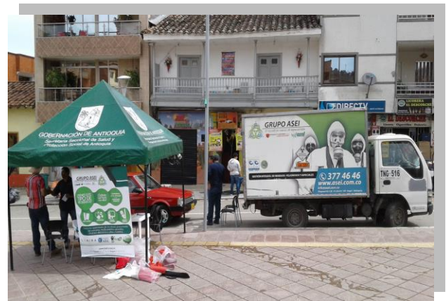
Imagen 7. Jornada de recolección respel.

Rionegro. Esta estrategia denominada “Finca Ambiental” busca brindar a los productores ganaderos, generadores de cantidades mínimas de residuos peligrosos (<10 kg), una gestión integral y adecuada de sus residuos a través de la unión de los programas de postconsumo de la ANDI y donde ASEI como operador logístico gestiona el transporte, tratamiento y disposición final de los residuos peligrosos.