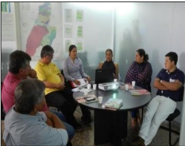
Imagen 8. Reunión con los productores beneficiarios del Convenio 2016-511 entre Porkcolombia-FNP y Cortolima

Bajo el marco del convenio 097 de 2010 suscrito entre Porkcolombia-FNP y CORTOLIMA Se firmó el convenio de cooperación para una producción más limpia cuyo objeto es aunar esfuerzos humanos, financieros y tecnológicos entre Porkcolombia-FNP y Cortolima para la implementación de buenas prácticas ambientales en el sector porcícola en el departamento del Tolima.