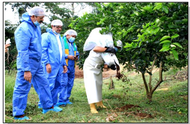
Imagen No.3 Visita Granja La Renta, CAS-Porkcolombia-FNP

Gracias a esta experiencia, actualmente se está culminando la directriz de legalidad para el sector porcícola y se suscribió la agenda ambiental 2016-2019 para el sector porcícola el 14 de Diciembre del año en curso.