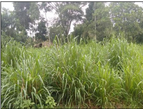
Imagen 2. Granja Sasoveva. Pastos Panicum Maximum Mombaza , fertilizados con porcínaza líquida. Sahagún-Córdoba.

Bajo jurisdicción CVS, participaron 59 productores en los talleres de porcicultura ambiental, se realizaron 25 visitas de acompañamiento a granjas porcícolas ubicadas en diferentes municipios del Departamento de Córdoba.