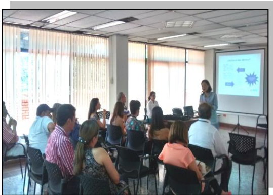
Imagen 14. Socialización de la Resolución 1541 de 2013 y el estudio de olores ante CVC

Esta es una de las estrategias diseñadas entre Porkcolombia-FNP y el MADS para la armonización de la Resolución 1541 de 2013 entre las Autoridades Ambientales, el sector porcícola y la comunidad.