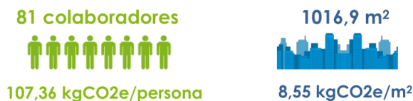
Imagen 2. Emisiones de CO 2 e por colaborador y por área de la Asociación Porkcolombia.

Del estudio realizado por ECOLOGIC, se obtuvo que la Asociación Porkcolombia emitió 8,70 toneladas de CO 2 e en el año 2016 de las cuales, 4,07 toneladas (46,75%) fueron emisiones directas (alcance 1), es decir, emisiones que ocurren de fuentes que son propiedad o están controladas por la Asociación Porkcolombia (emisiones por consumo de gas refrigerantes). Las 4,63 toneladas de CO 2 e (53,25%) restantes fueron emisiones indirectas (Alcance 2) asociadas al consumo de energía eléctrica.