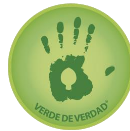
Imagen 1. Sello verde de verdad®

¡Asociación Porkcolombia, el primer gremio agropecuario en obtener el sello verde de verdad®!