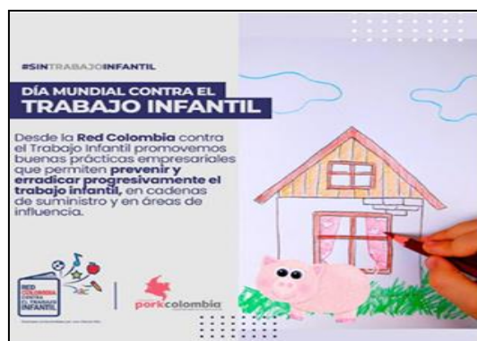
Imagen 2. Visibilización alusiva al año internacional para la eliminación del trabajo infantil.

El 12 de junio se conmemoró el día internacional contra del maltrato infantil. Porkcolombia-FNP en virtud de alinear estrategias y operaciones con los principios universalmente aceptados en cuatro áreas temáticas, se adhirió a esta campaña promoviendo los principios universalmente reconocidos por pacto global: Derechos Humanos, Estándares Laborales, Medio Ambiente y Lucha Contra la Corrupción, así como con la intención de contribuir con la consecución de los Objetivos de Desarrollo Sostenible (ODS), durante el mes de junio de 2021 desarrollo acciones de visibilización de información alusiva al año internacional para la eliminación del trabajo infantil, a través de sus redes sociales oficiales.