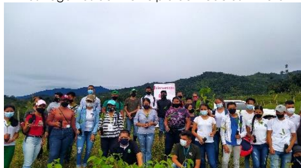
Imagen 16. Participantes de la siembra en la granja las Eugénias del municipio de Acacias – Meta

cuenta con cuerpos hídricos de importancia para la región.