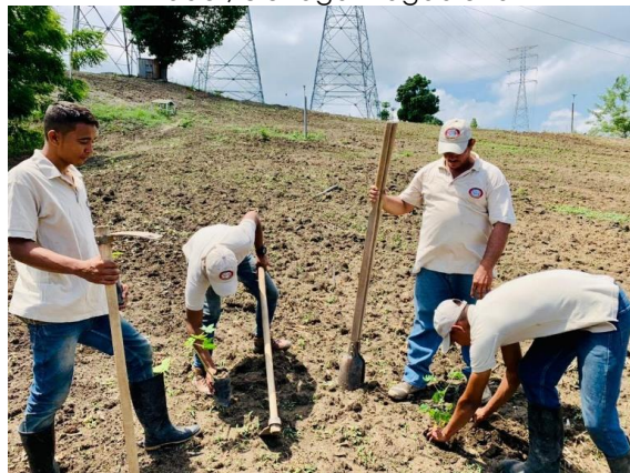
Imagen 12. Siembra de árboles en la granja El Mirador, ciénaga Magdalena