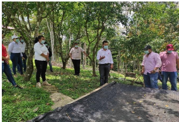
Imagen 7. Registro Fotográfico Taller de Fertilización Córdoba-PORKCOLOMBIA

profesionales de la CVS y de la UMATA del municipio de Sahagún