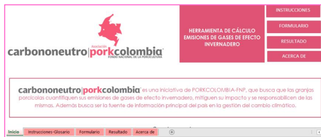
Imagen 4. Herramienta carbono neutro Porkcolombia-FNP

El pasado 3 de junio del año en curso, se realizó la capacitación titulada “Carbono Neutralidad en la Porcicultura”, en la que participaron los profesionales de las CAR del eje cafetero (CORPOCALDAS, CRQ y CARDER). En esta capacitación se realizó una introducción virtual al concepto de carbono neutralidad y se presentó la herramienta carbono neutro, iniciativa de Porkcolombia-FNP, que busca que las granjas porcícolas cuantifiquen sus emisiones de gases de efecto invernadero, mitiguen sus impactos y se responsabilicen de las mismas, además busca ser la fuente de información principal del país sobre la gestión de cambio climático para el sector porcícola.