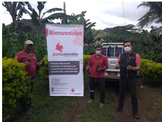
Imagen 8. Entrega de 200 plántulas de Guayacán Amarillo para siembra en la granja porcícola La Mina, San Lorenzo, Nariño.

Entre las iniciativas destacadas se encuentra la participación en la jornada de SEMBRATON, donde se sembraron 300 árboles de especies nativas en la granja porcícola Llano Largo ubicada en el municipio de Buesaco, departamento de Nariño, y se entregaron y sembraron 200 plántulas de árboles nativos en la granja porcícola La Mina ubicada en el municipio de San Lorenzo, departamento de Nariño.