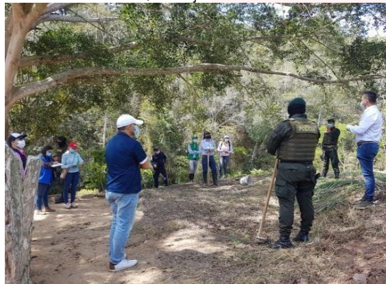
Imagen 14. Taller de fertilización con porcínaza sólida, Lebrija Santander

En el municipio de Floridablanca, granja la Turena se realizó el taller sobre responsabilidad Social Empresarial (RSE), contando con la participación de 11 colaboradores. Los temas tratados fueron la Historia de RSE, los componentes de la RSE, Implementación RSE, Beneficios de RSE, Experiencias Exitosas y se desarrolló un ejercicio de cartografía social.