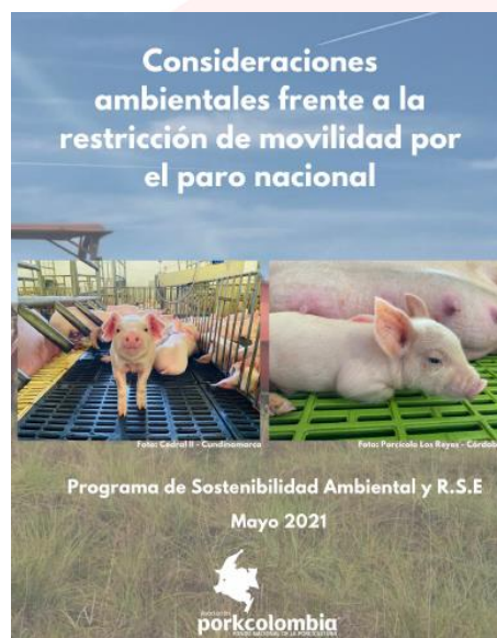
Imagen 3. Portada cartilla “Consideraciones ambientales frente a la restricción de movilidad por el paro nacional”

Este documento, que puede ser descargado desde la página web oficial de Porkcolombia, presenta recomendaciones y sugerencias, relacionadas con el manejo de mortalidades en granjas porcícolas, manejo de la porcínaza, manejo de residuos ordinarios y de residuos peligrosos, así como sobre el abastecimiento y gestión eficiente de agua.