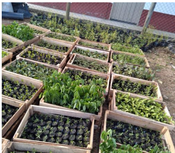
Imagen 15. Plántulas entregadas empresas de la jurisdicción CORNARE

acuerdo de crecimiento verde entre el sector porcícola y la autoridad ambiental CORNARE, en la estimación de huella de carbono correspondiente al año 2020, así como en el planteamiento de metas de reducción de GEI, esto con el fin de aportar en el cumplimiento de las metas nacionales de minimización de gases efecto invernadero.