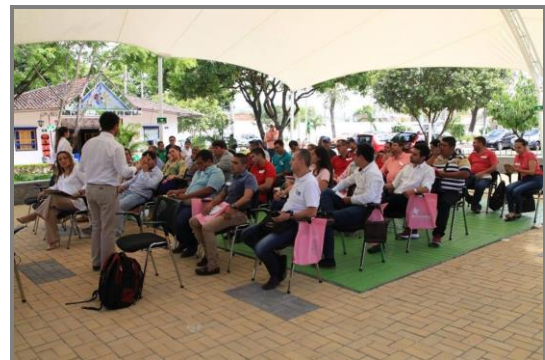
Imagen 14. Taller "suelos fértiles y sostenibles" desarrollado en el Huila

Talleres teóricos prácticos en fertilización orgánica: “Suelos fértiles y sostenibles”.