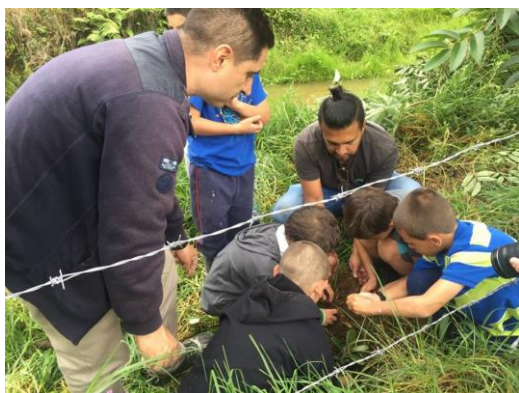
Imagen 11. Siembra de árboles en La Ceja.

Además, en compañía de la comunidad, Cornare y porcicultores de la zona, se realizó una jornada de siembra de árboles para la protección de la fuente hídrica que surge en las cercanías de las instituciones educativas.