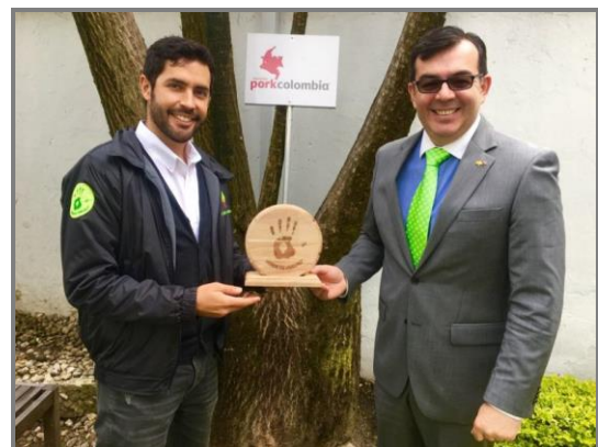
Imagen 3. Renovación del sello verde de verdad ® .

La huella de carbono permite medir el desempeño ambiental de la Asociación Porkcolombia ya que se reconocen las emisiones causadas por el uso de gases refrigerantes, energía eléctrica y el manejo de residuos. Este inventario, se convierte en un instrumento clave para identificar las principales fuentes de emisión de Gases de Efecto Invernadero (GEI) de la organización así como implementar soluciones reales en torno a la disminución de las emisiones. Lo anterior, es un paso importante hacia la sostenibilidad de la organización, compromiso que se expandirá a los productores porcícolas porque el sector quiere y está comprometido con cuidar y preservar el medio ambiente a través del uso eficiente de los recursos para no comprometer los recursos de las futuras generaciones.