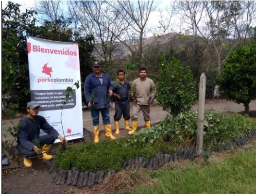
Imagen 17. Entrega de árboles a la granja San Carlos en Nariño.