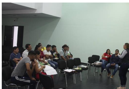
Imagen 9. Taller de legalidad ambiental para productores de la provincia guanentina.

Bajo el marco de la agenda ambiental firmada entre Porkcolombia-FNP y la CAS, se Realizó el primer taller de legalidad ambiental con porcicultores de la provincia guanentina. El objetivo de este taller fue de informar a los porcicultores, el estado en el cual se encuentra cada proceso e ilustrarlos sobre los correctivos que se deben ejecutar.