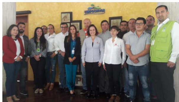
Imagen 13. Firma agenda ambiental con Corpochivor.

Como primera tarea a realizar será la formulación de la directriz de legalidad para establecer los trámites y permisos ambientales a presentar ante la autoridad ambiental y junto con Producción más limpia se desarrollará mesa de trabajo para implementación de proyectos pilotos demostrativos de porcicultura sostenible.