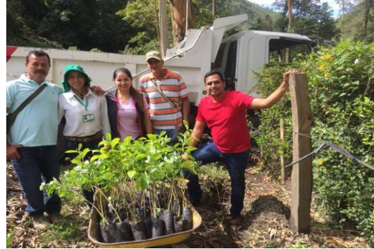
Imagen 6. Entrega de árboles a productores del Tolima.

quebradas que abastecen de agua a las producciones.