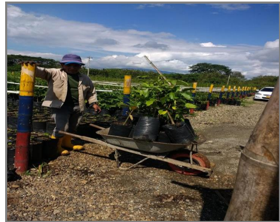
Imagen 16. Entrega de árboles para productores del Valle del Cauca.

En aras del desarrollo sostenible de la porcicultura, la secretaría de Agricultura del Valle del Cauca, realizó la entrega de 80 árboles a porcicultores de la región para realizar actividades de reforestación en sus predios.