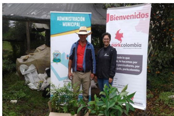
Imagen 12. Entrega de árboles para productores de Entreríos.

Estos árboles son destinados para la protección y conservación de fuentes hídricas y suelo, así como el establecimiento de sombrero, cercas y/o barreras vivas en predios porcícolas.