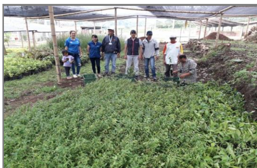
Imagen 8. Entrega de árboles a productores de Silvania y Fusagasugá. Corporación Autónoma Regional de Santander- CAS

Con el apoyo de la CAR y bajo el marco del programa de excelencia ambiental se entregaron 5.000 árboles nativos de las especies Guayacán de Manizales, Acacia Amarilla, Ocobo, Nacedero, Moncoro y Casco de Vaca a porcicultores de Fusagasugá y Silvania, generando conciencia para la conservación del recurso hídrico y los recursos naturales en la jurisdicción de Sumapaz. Los árboles fueron aporte de la Gobernación de Cundinamarca y el Centro Internacional de Física.