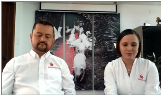
Imagen 18. Facebook Live aprovechamiento y uso sostenible de la porcinoza.

Con el fin de mantener informados a los productores y demás grupos de interés sobre diferentes temas relacionados con la gestión ambiental en granjas porcícolas, Porkcolombia-FNP desarrolló en el trimestre, dos Facebook Live, uno sobre la huella de carbono y otro sobre las bondades de la porcinoza.