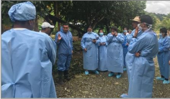
Imagen 5. Escuela de campo con Cormacarena en granja porcícola del Meta.

Durante la jornada, los asistentes pudieron conocer la Guía Ambiental para Sistemas de Producción Porcícola en el departamento del Meta, en la que se detallan aspectos como: el impacto ambiental que se genera a los recursos agua, suelo y aire, y las prácticas ambientales que deben implementarse para disminuir su impacto. Estas buenas prácticas ambientales aseguran además, la calidad en la producción de carne de cerdo, obteniendo un alimento sano que no genera riesgo para la salud de los consumidores.