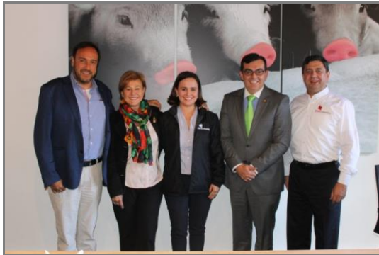
Imagen 2. Firma de la alianza entre Porkcolombia-FNP y Fundación Natura.

Esta alianza vigente hasta el 31 de diciembre de 2019, es la formalización de una colaboración mutua entre las partes a fin de: