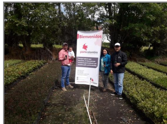
Imagen 7. Entrega de árboles a productores de Boyacá.

En el marco de la Agenda ambiental firmada con Corpoboyacá, se desarrolló el programa de Excelencia Ambiental con la entrega de 1500 árboles de las especies: Mortiño, Arroyan, Aliso, Roble, Garrocho y Guayacán para la siembra de cercas vivas y conservación de fuentes hídricas en predios porcícolas.