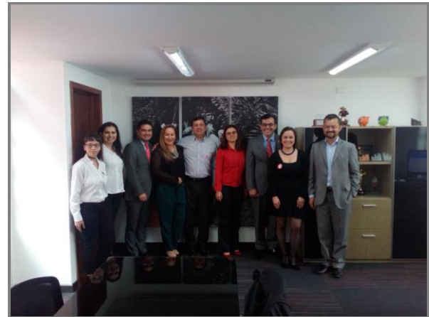
Imagen 1. Adhesión de Porkcolombia-FNP al Pacto Global de las Naciones Unidas.

Pacto Global se considera un marco de acción que facilita la legitimación social de los negocios y los mercados. Aquellas organizaciones que se adhieren al Pacto Global comparten la convicción de que las prácticas empresariales basadas en principios universales contribuyen a la generación de un mercado global más estable, equitativo e incluyente, y que fomenta sociedades más prósperas.