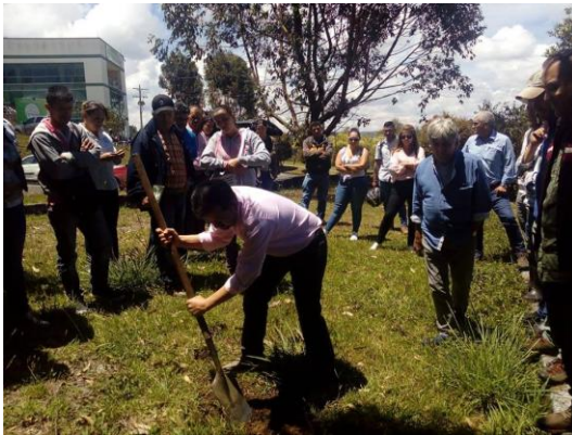
Imagen 15. Taller "suelos fértiles y sostenibles" desarrollado en Antioquia.

Con el objetivo de realizar un aprovechamiento de la porcinoza como una enmienda orgánica para el suelo, con responsabilidad ambiental y sin causar daños a los recursos naturales, Porkcolombia-FNP ha venido desarrollando con el apoyo de las autoridades ambientales. Los talleres teóricos prácticos de fertilización orgánica "suelos fértiles y sostenibles" se han desarrollado en los departamentos del Huila y Antioquia con el apoyo de la Cam, Cornare y Corantioquia y donde han participado más de 130 productores en total.