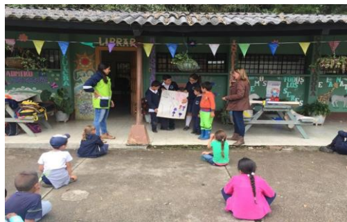
Imagen 10. Actividad de concientización ambiental a estudiantes del municipio de La Ceja.

Bajo el marco del programa de excelencia ambiental y con el objetivo de impactar positivamente la comunidad del colegio Alfonso Nano Bernal y del colegio COREDI, en el municipio de La Ceja, vereda La Playa, se desarrollaron actividades de concientización ambiental y socialización de la actividad porcícola como núcleo del desarrollo de la zona.