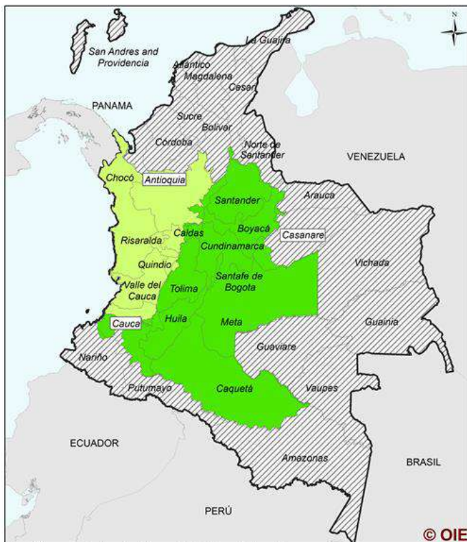
El estatus sanitario oficial para la PPC en Colombia