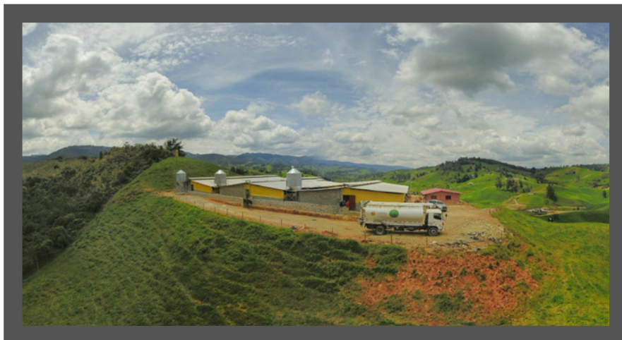
Granja Villa Graciela S.A.S - Antioquia

En la presentación de los indicadores económicos se destacó la importancia de adelantar la actividad productiva, bajo premisas como: crecimiento ordenado de la producción, integración de los eslabones productivos, contar con un mayor portafolio de riesgos, así como monitorear exhaustivamente la rentabilidad del sector.