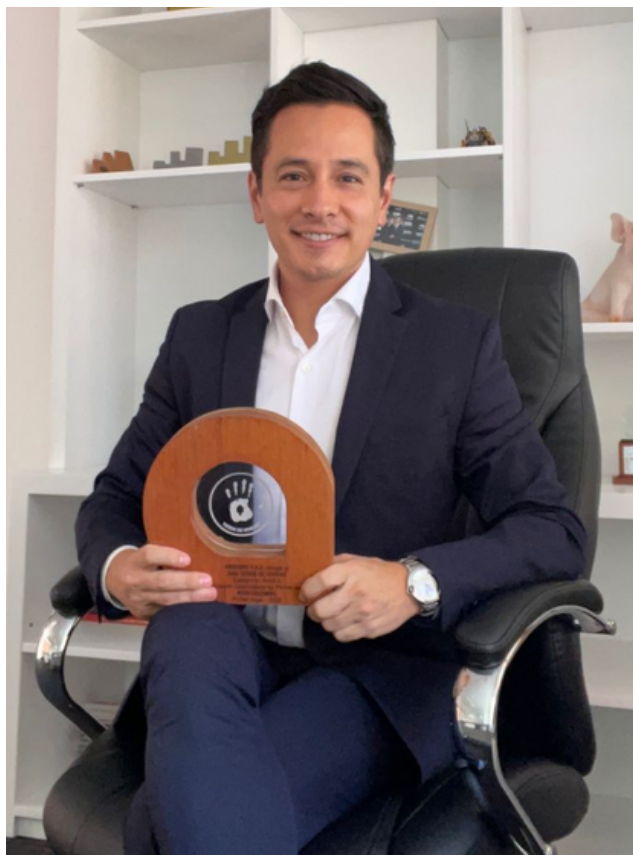
El pasado 11 de febrero Porkcolombia recibió el Sello Verde de Verdad por parte de la organización CO2CERO.