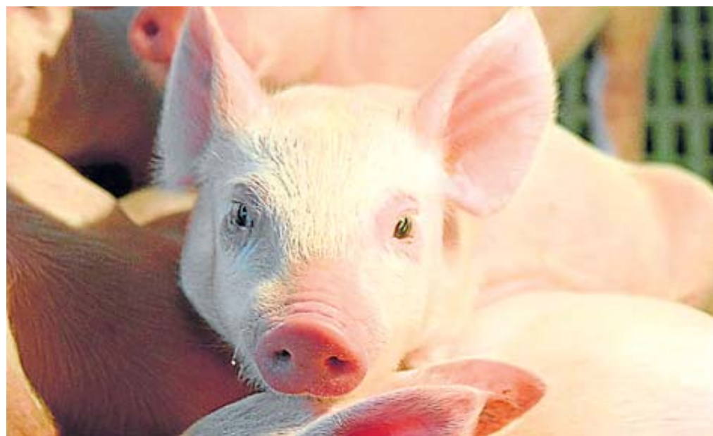
Antioquia es el mayor productor porcícola del país.

El gremio de productores porcícolas de Colombia data de 1983 cuando se creó la Asociación Colombiana de Porculcultores. En 2016 se transforma en Porkcolombia.