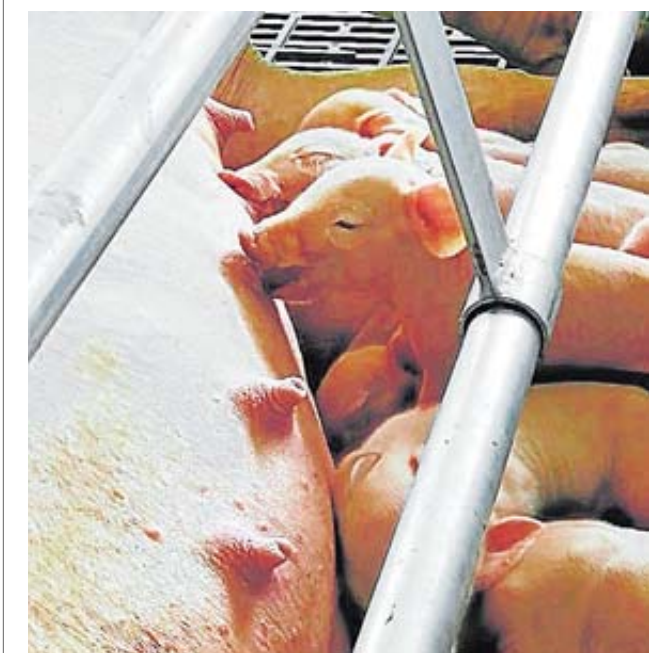
Aunque en Bolívar existe una alta informalidad en el sector porcícola, hay empresas, como Nutrinal, que se tecnifican para ser competitivas.

do y ello generó un vacío del 25% de la proteína animal que se producía en el mundo en un año. Asia es el mejor mercado potencial y a China y Vietnam le apuntan los productores nacionales para insertarse en la dinámica importadora de esos mercados, como también en Macao, Hong Kong, Singapur y Corea del Sur. Las importaciones representan un poco más del 20% del mercado. El 95% proviene de Estados Unidos, la Unión Europea y Chile. En 2010 el importado era el 10% del consumo total nacional y eran de materias primas derivadas de la carne de cerdo que se usaban para otra clase de alimentos con valor agregado, hoy ese porcentaje va directamente al consumidor final. Eso implica que los importados son competidor directo de la producción nacional.